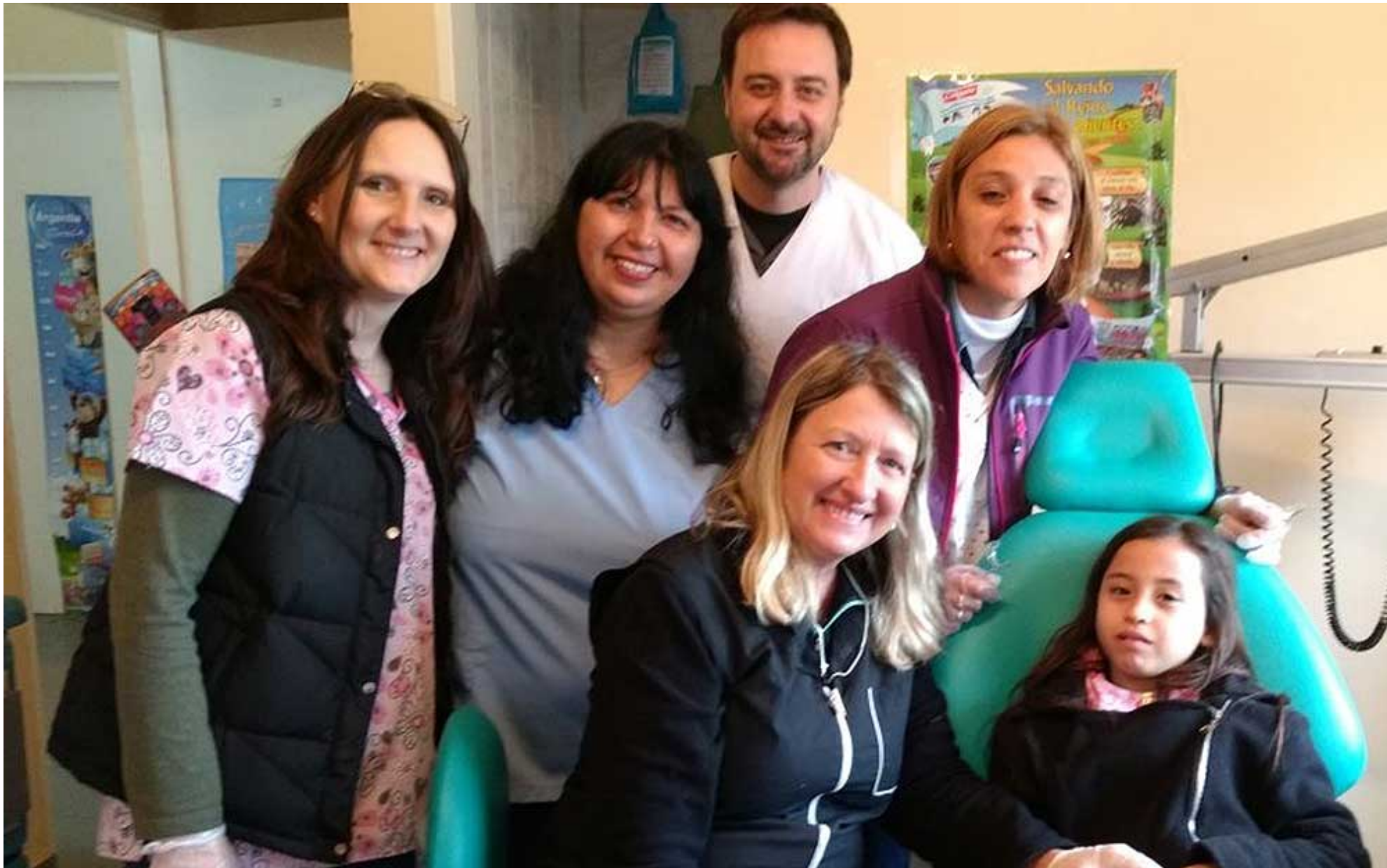
El equipo de Ortopedia en la Fundación Misión Esperanza.