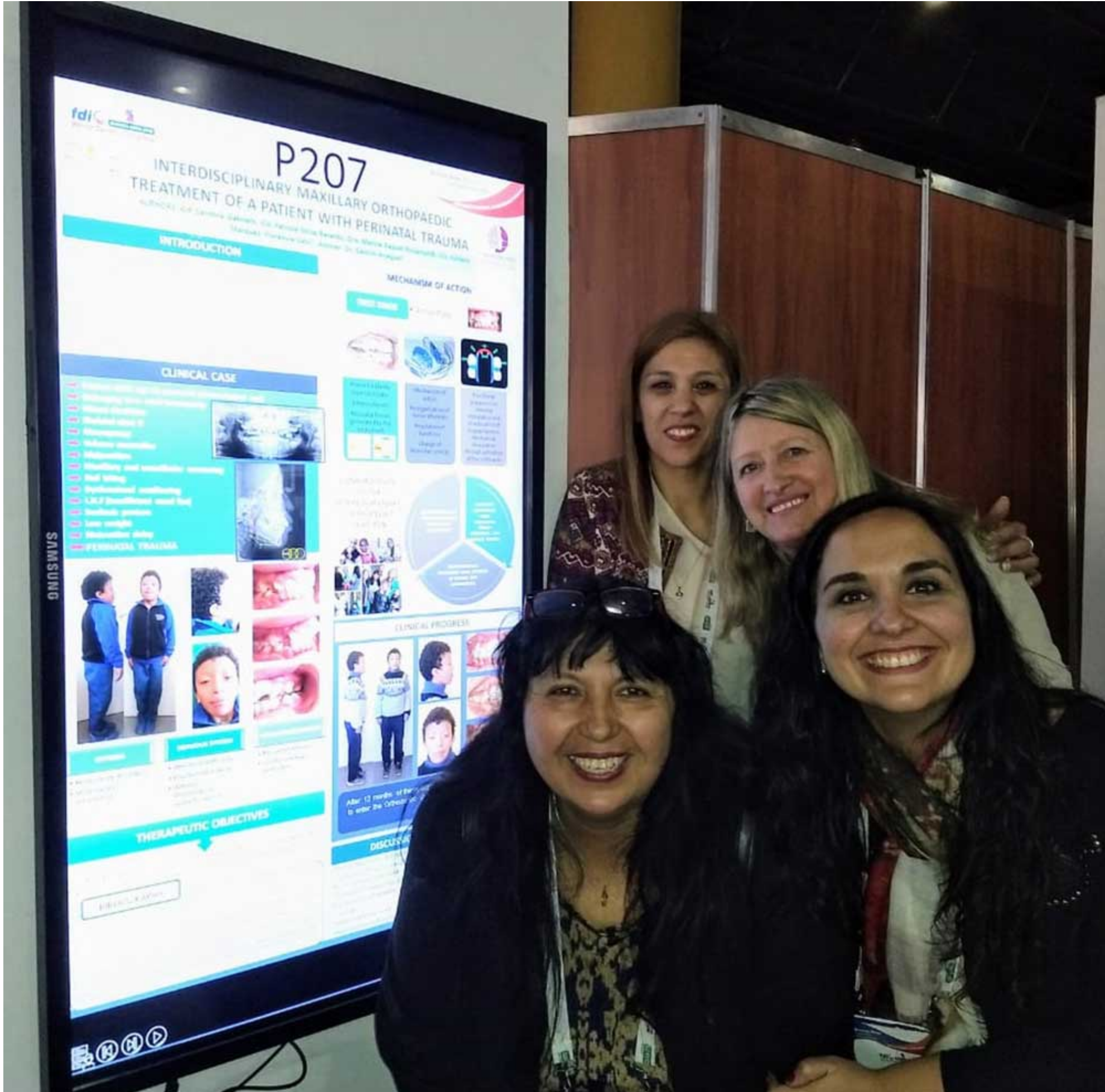
El equipo de Ortopedia en el Congreso Internacional FDI.